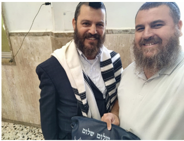
שלום שלום וישראל ביזור

הוא סיפר לי שהוא מתגורר בבתי ים, ועובד בתור פקח עירייה. בתוך הדברים הוא סיפר שכחלק מהעבודה הוא נאלץ לעבוד בשבת, והדבר חורה לו מאוד