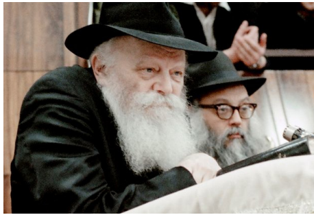
הרבי שליט"א מלך המשיח

התייחסותו השמיימית והבלתי מובנת בשעתו של הרבי שליט"א מלך המשיח, להמשך הלחימה בבצרה – שהתגשמה לאחר 12 שנה, היא ככל נבואותיו לדורנו – המחזקת אותנו באמונה וודאית בהתגשמות נבואתו "הנה זה משיח בא".